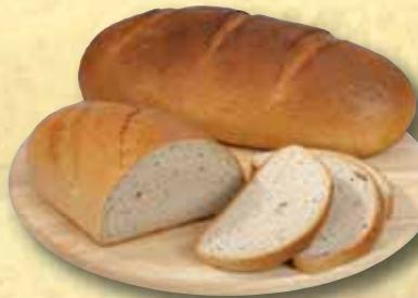
Kminový chléb 1000 g