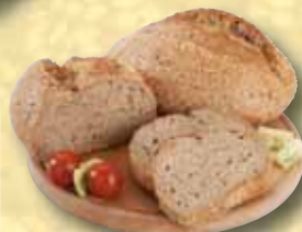
Chléb Fitíček 350 g