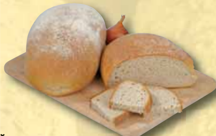
Chléb Šumava Globus 500 g