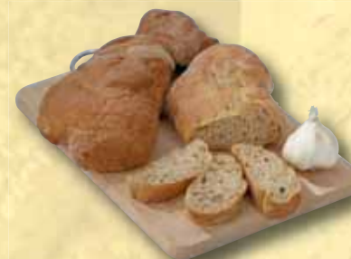
Kořenový chléb 250 g