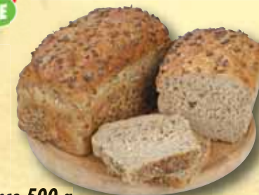
Chléb Král slunce 500 g