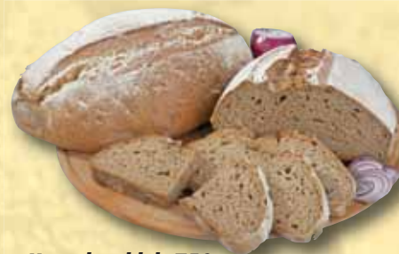
Kozácký chléb 750 g