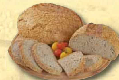
Chléb Fit 700 g

Kminový chléb 500 g Chléb Šumava Globus 500 g Krušnohorský chléb 750 g Kozácký chléb 750 g Chléb Fit 700 g