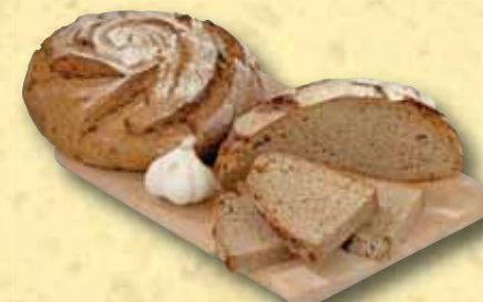
Krušnohorský chléb 750 g

VOLIT „GLOBUS CHLĚB ROKU 2007“ MŮŽETE TAKÉ NA INTERNETOVÝCH STRÁNKÁCH WWW.GLOBUS.CZ .