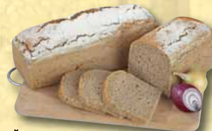
Žitný chléb 1000 g

Kminový chléb 500 g Chléb Šumava Globus 500 g Krušnohorský chléb 750 g Chléb Král slunce 500 g Chléb Fit 700 g