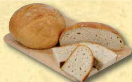
Kminový chléb 500 g

Vážení zákazníci, od pátku 16. 3. 2007 do neděle 1. 4. 2007 můžete volit GLOBUS CHLĚB ROKU 2007. Z celé nabídky téměř dvaceti druhů chleba, které pro Vás pečeme čerstvé několikrát denně v naší Pekárně Globus přímo v každém hypermarketu, jsou nominovány tyto druhy: