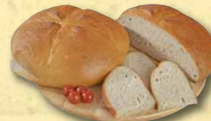
Rodinný chléb Globus 1500 g