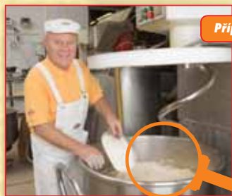
Příprava a mísení těsta.

Chleby v Pekárně Globus pečeme v průběhu celého dne. Přijít pro čerstvý nákup můžete kdykoli.