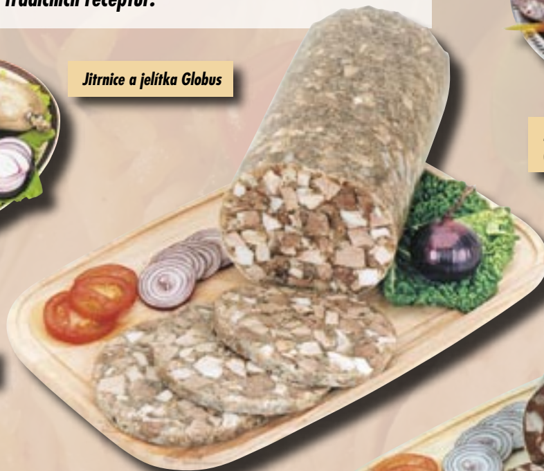
Světlá tlačenka Globus