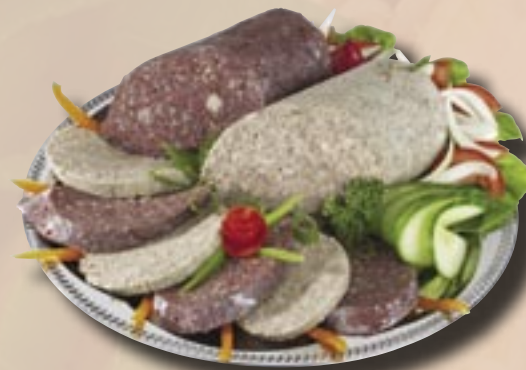
Světlý (jaternicový) a tmavý (jelítkový) prejt Globus