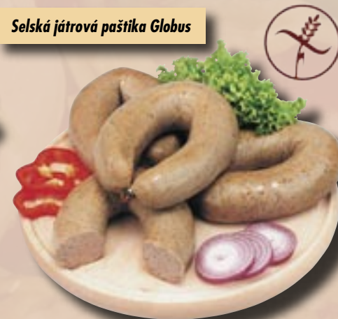
Selská játrová paštika Globus