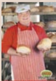
Příprava masových výrobků od 7.00