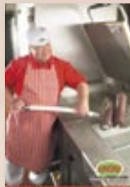
Společně zpracování masových výrobků od 6.30