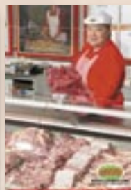
Zahájení prodeje od 8.00

Je to jednoduché: vyberte si jeden z našich hypermarketů, objednejte si maso nebo uzeniny a zadejte dobu, kdy si je vyzvednete.