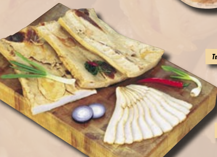
Uzená slanina Globus