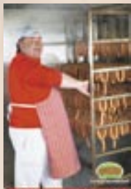
Společně zpracování masových výrobků od 6.30