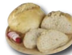
Česnekáček, 350 g