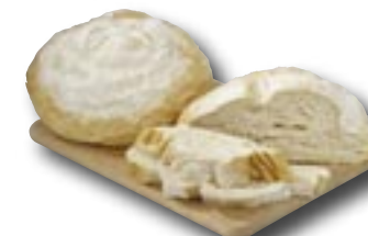
Francouzský venkovský chléb, 500 g