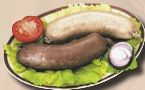
Jitrnice a jelítka Globus

Bliží se zima a s ní čas vepřových hodů. A k řeznictví patří samozřejmě i tradiční zabijačkové výrobky. Nabízíme jich celou řadu a věříme, že tyto zabijačkové speciality uspokojí každého, kdo si chce pochutnat. Vždyť všechny tyto výrobky pro Vás připravujeme několikrát denně čerstvé, přímo v zázemí každého hypermarketu, ve vlastním řeznictví Globus, podle tradičních receptur.