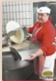
Míchání masových výrobků od 6.00