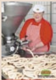
Výroba masových výrobků od 6.15