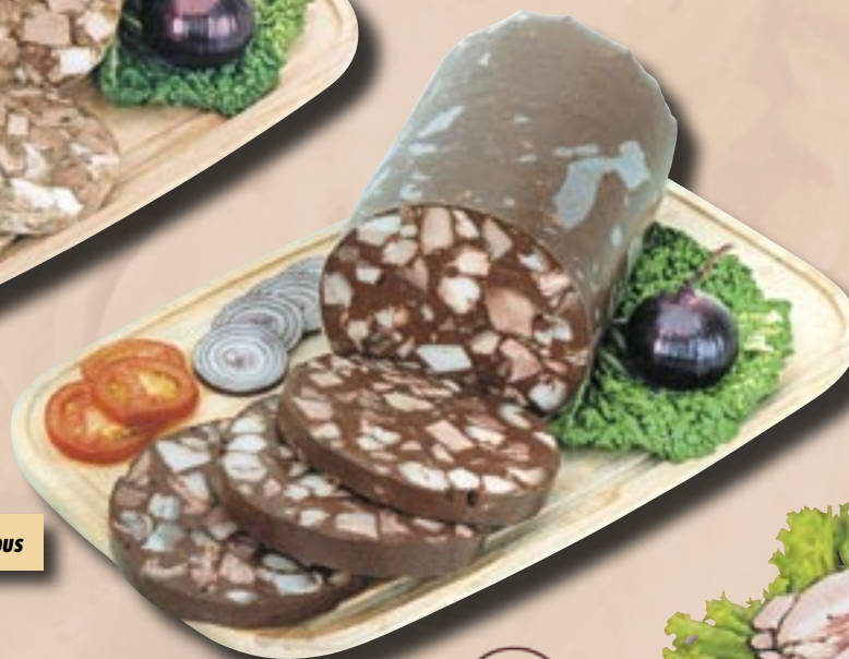
Tmavá tlačenka Globus