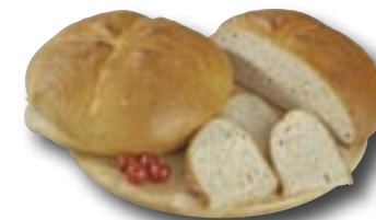
Rodinný chléb, 1500 g