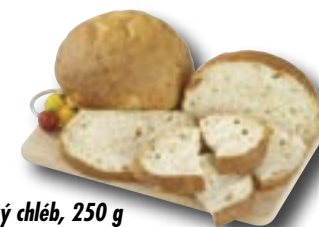
Cibulový chléb, 250 g