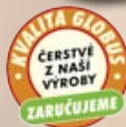
Anglická slanina Globus