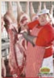
Brečtan od 5.30