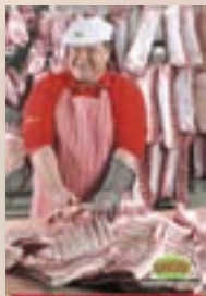
Příprava masa od 6.00