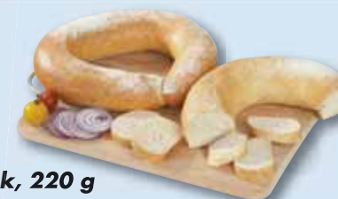
Italský kroužek, 220 g