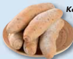
Kornspitz, 55 g