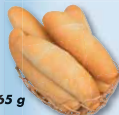
Královský rohlík Globus, 65 g