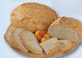
Kořenový chléb Globus, 250 g