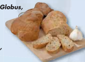
Chléb Fit Globus, 700 g