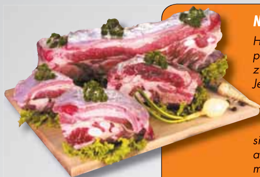
Hovězí žebro s kostí