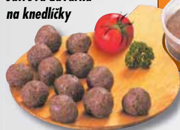
Játrová zavářka na knedlíčky