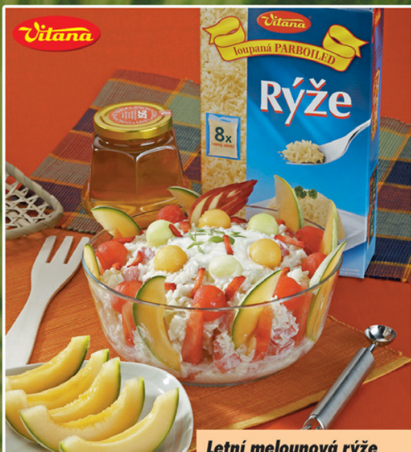
Loupanou rýži Vitana zakoupíte v našem hypermarketu.