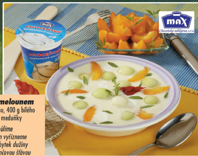
Bílý jogurt MAX z Choceňské mlékárny zakoupíte v našem hypermarketu.

Z pomeranče vymačkáme šťávu. Meloun rozpůlíme a zbavíme jadérek, kulčkovým vypichovačem vyřízneme z dužiny cca 10 kulčků a dáme je stranou. Zbytek dužiny nakrájíme nadrobno, rozmixujeme s pomerančovou šťávou a promícháme s jogurtem. Dáme do misky a přízdobíme melounovými kulčičkami, snítkami meduňky a kousky meruňek.